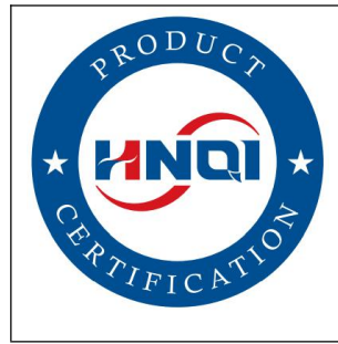
图 1 HNQI 认证标志基本样式

各类不同产品认证标志的样式，是在基本样式（图 1）的基础上分别辅以代表相应认证特性的文字或图案。